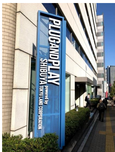
Plug and Play shibuya